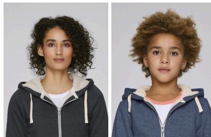
Stella Travels Sherpa