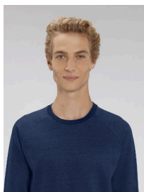
Stanley Stroller Denim