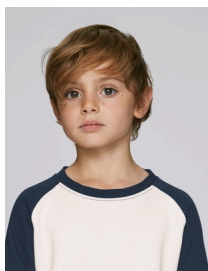
Mini Scouts Contrast