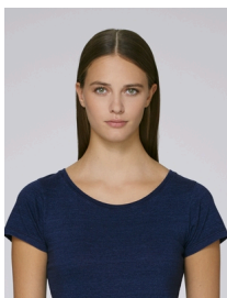
Stella Wants Denim