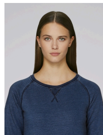
Stella Trips Denim