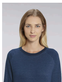
Stella Tripster Denim