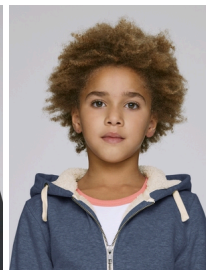
Mini Voyages Sherpa