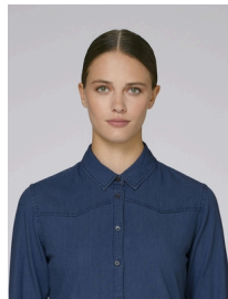
Stella Inspires Denim

Laver et sécher séparément, ne pas repasser sur l'endroit, repasser sur l'envers. Ce vêtement est un article de denim délavé. L'effet jean délavé s'accroît avec le temps. La couleur peut déteindre sur les tissus clairs. Utiliser un détergent doux sans agent blanchissant.